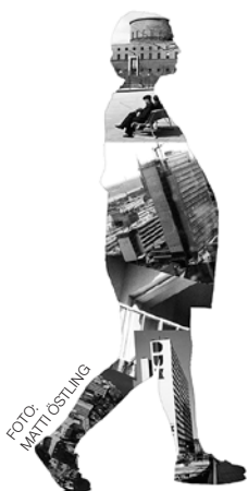
Fotomontage von der Ausstellung des Architekturmuseums „Den ludna staden“ (Die haarige Stadt)