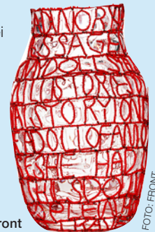
Vase von Front