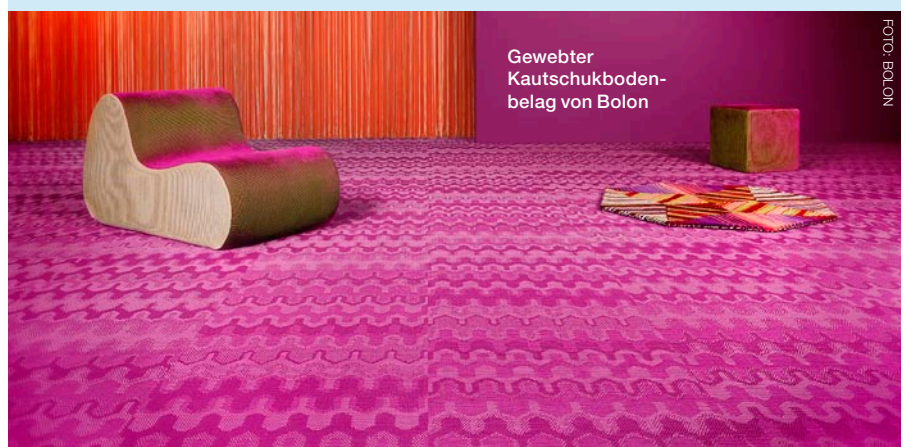
Gewebter Kautschukbodenbelag von Bolon